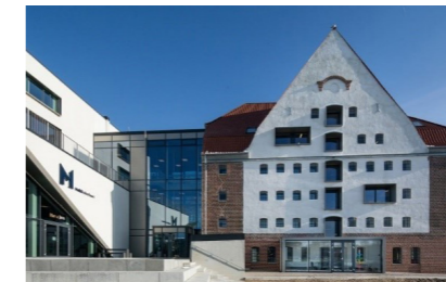
Hovebiblioteket i Multikulturhuset Sønderborg

Stk. 4. Kommunalbestyrelser kan nedsætte et biblioteksråd med henblik på samordning af biblioteksvirksomheden mellem flere kommuner.