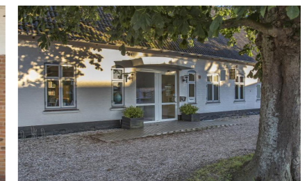
Biblioteket Vester Sottrup